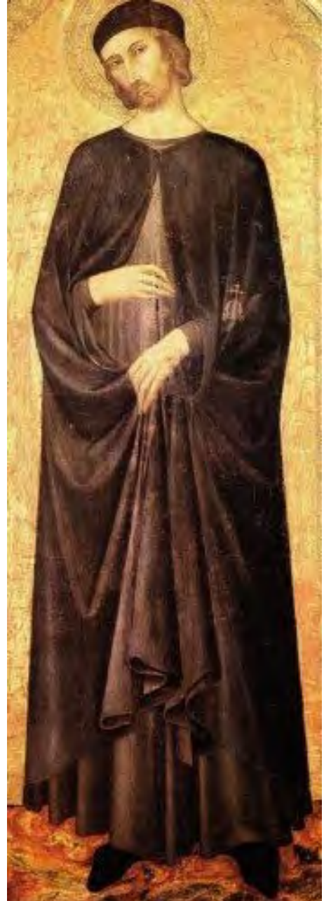
Beato Andrea Gallerani