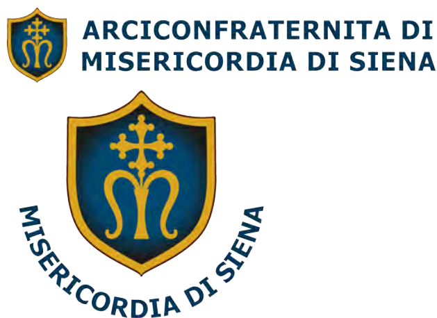
Due nuove versioni grafiche del logo e della parte scritta